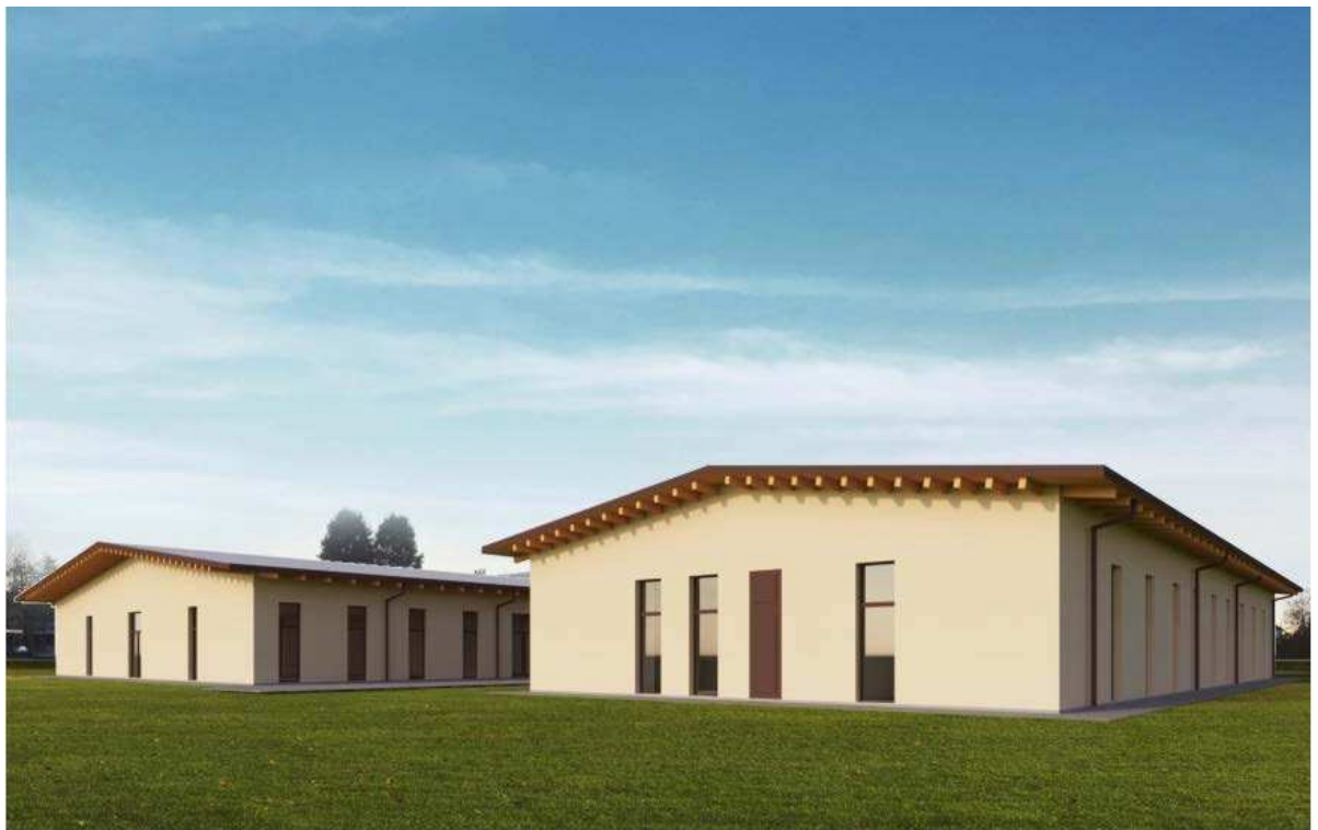
Fotoinserimento con l'asilo nido in primo piano ed il passaggio coperto con la scuola dell'infanzia (in secondo piano).

REALIZZAZIONE DI UN POLO PER L'INFANZIA - NUOVO ASILO NIDO